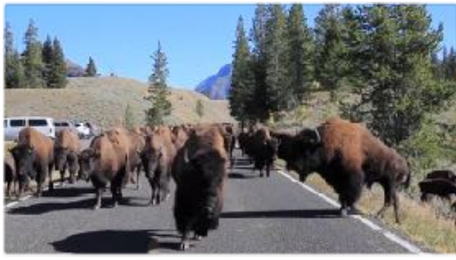
Kudde bizons op stap in Yellowstone