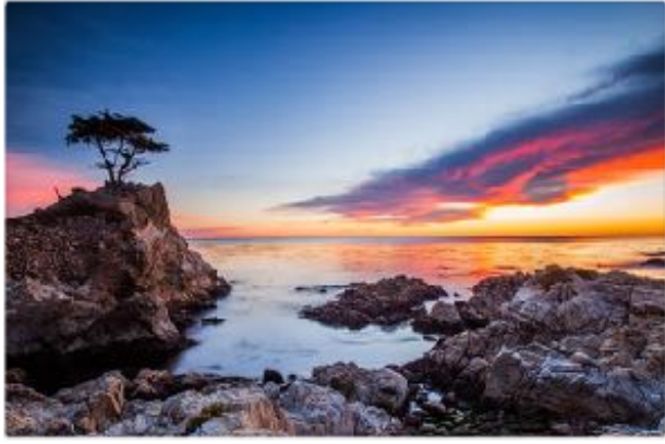
The Lonely Cypress

dan Clint Eastwood hier enige tijd burgemeester is geweest. Het is er nu vooral een toeristische trekpleister, met verschillende mooie shopping areas. Clint hebben we niet gezien trouwens.