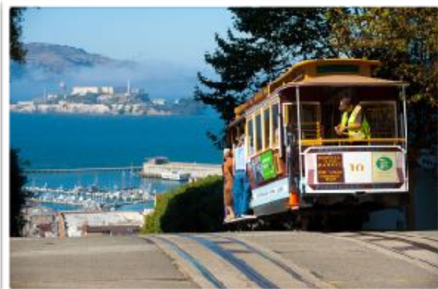
Cable car in San Francisco

Iets verderop weer een totaal andere verrassing : hele kolonies zeehonden, bijna binnen handbereik. Een prachtig zicht om deze dieren, die de meesten onder ons slechts in de zoo of circus hebben gezien, in volle vrijheid te kunnen bewonderen.