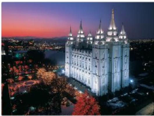
Salt Lake City