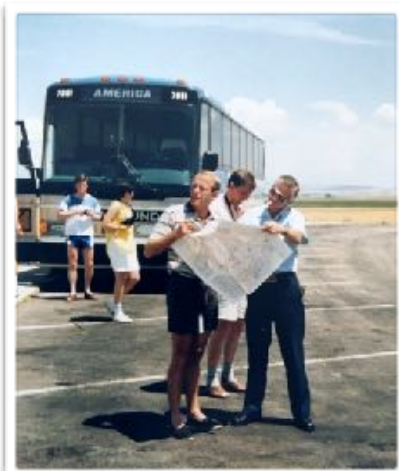
Lost in the middle of nowhere