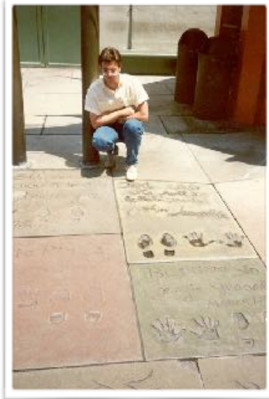
Voetpad voor het Chinese Theatre