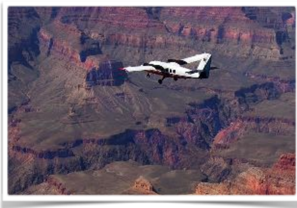
Met een vliegtuigje boven de Grand Canyon

filmrolletje enkel aan dit wonder van de natuur opgebruikt, zo adembenemend mooi is het hier.